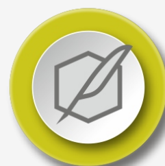
Elenco di bozze di design