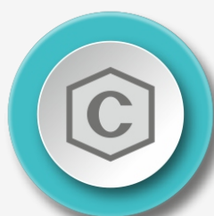
Note di credito